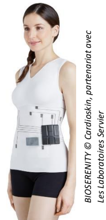
BIOSERENITY © Cardiaskin, partenariat avec Les Laboratoires Servier

BioSerenity a développé un modèle d'affaires efficace en partenariat avec l'industrie pharmaceutique. Les partenariats reposent sur la création d'une solution technologique complète (dispositif physique, application mobile, cloud, analyse automatique des données par Intelligence Artificielle) centrée sur une pathologie dont le laboratoire pharmaceutique est spécialiste. Le laboratoire pharmaceutique utilise alors sa force de frappe pour déployer la solution dans le monde entier et bénéficie de son usage en interne pour ses essais cliniques.